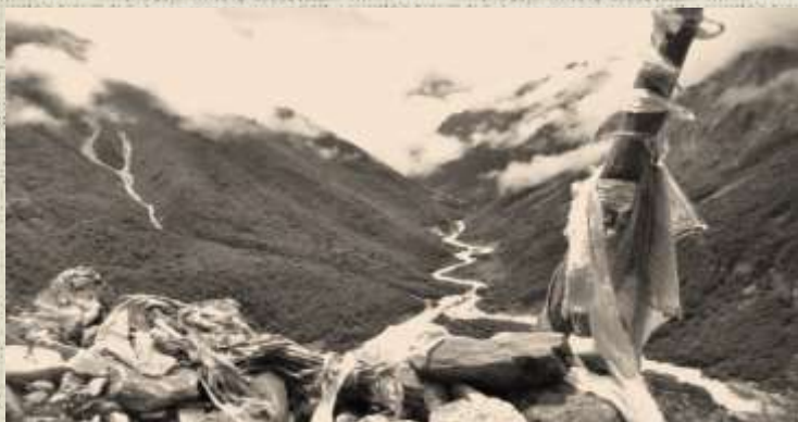
Núi thiêng Lapchi nơi Đức Milarepa đã thành đạo